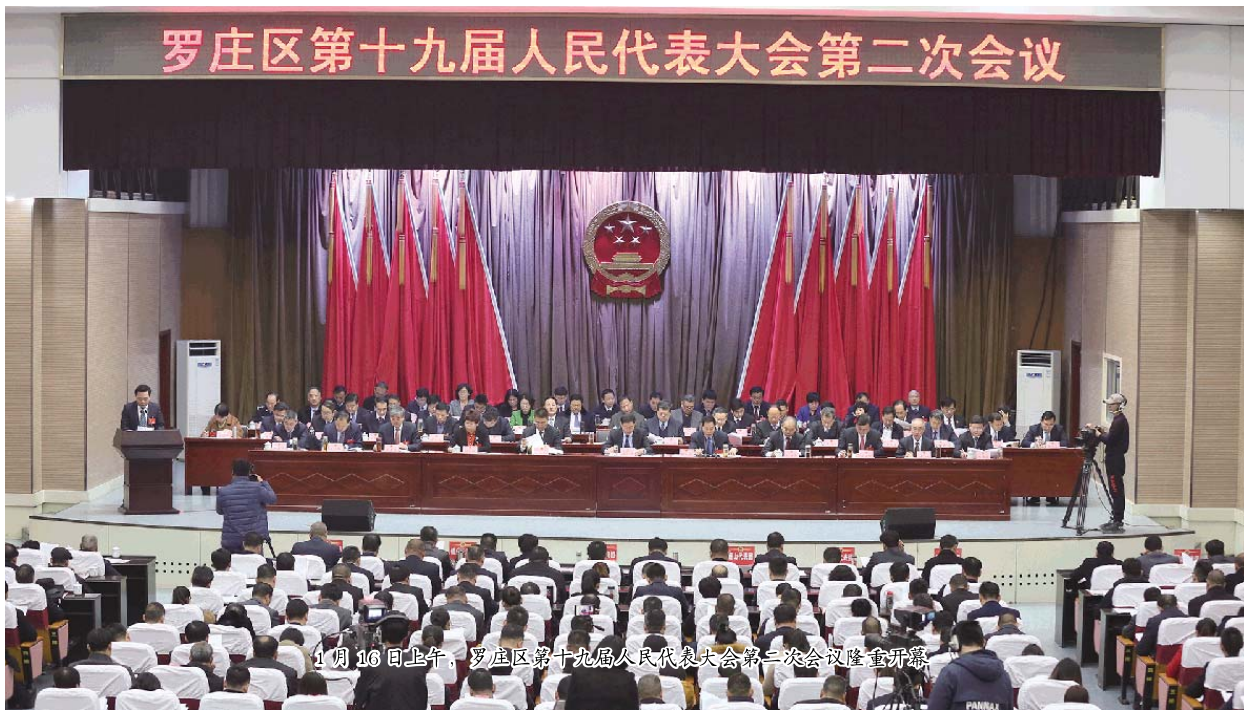
罗庄区第十九届人民代表大会第二次会议