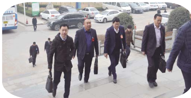
人大代表陆续入场