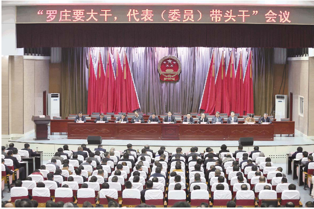
循环低碳发展转变。要突出加快发展，坚决杜绝慢发展、不发展；突出创新发展，坚决杜绝“守旧”观念、“守常”思维、“守成”思想；突出高效发展，坚决杜绝低效能、低层次、低水平、低档次、低标准；突出绿色发展，坚决杜绝不

环保、不清洁、不低碳、不可持续的发展。 三要带着新的境界干。要做到眼界要高，坚持世界眼光、国际标准、罗庄特色、高点定位；标杆要高，同强的比、向上的攀、与勇的争、跟快的赛，放眼全省全国找样板、定坐标、争位次；标准要高，做标准上的制定者、技术上的领跑者、工作上的先行者。 四要带着新的责任干。突出“四个负责”：一是对上级负责。始终做到坚决拥护、坚决听从、坚决维护习近平总书记的核心地位，坚定不移贯彻落实中央决策部署和省市重大安排。二是对全区负责。坚定不移、不折不扣贯彻落实区委、区政府工作目标、重大决策部署、重大工程，同心同向、同力同行、同频共振。三是对群众负责。要牢记以人民为中心，深入基层、深入一线、深入群众，广听民意、广集民智、广纳良策。四是对自己负责。把个人追求融入到“突破罗庄、走在前列”中去，在干事创业中实现人生价值。 五要带着新的激情干。要做到朝气、志气、勇气、锐气、豪气“五气齐聚”，冲劲、闯劲、狠劲、拼劲、韧劲“五劲齐发”，心往一处想、劲往一处使，喊出同一个声音、迈出一个步调、奔向同一个目标。 六要带着新的价值干。就是要在干事创业、拼搏奋进中实现人生价值。只有拿出敢叫日月换新天的气概，敢啃硬骨头，拼上豁上，大干实干，我们才能实现人生价值，才能实现建设现代生态产业区、富强和美新罗庄的目标。 刘凯在主持讲话中强调，代表委员要认真学习贯彻落实总书记的讲话精神，按照总书记的六个干的要求，要做改革派、实干家，要做领头雁、排头兵，要做好宣传员，提高政治站位，强化行动自觉，抓住发展第一要务、创新第一动力，自觉在全区工作大局中找准位置，聚焦发力，多建睿智之言、多献创新之策、多谋务实之举，在建设富强和美新罗庄的征程中做出新的贡献。 (王庆龙)