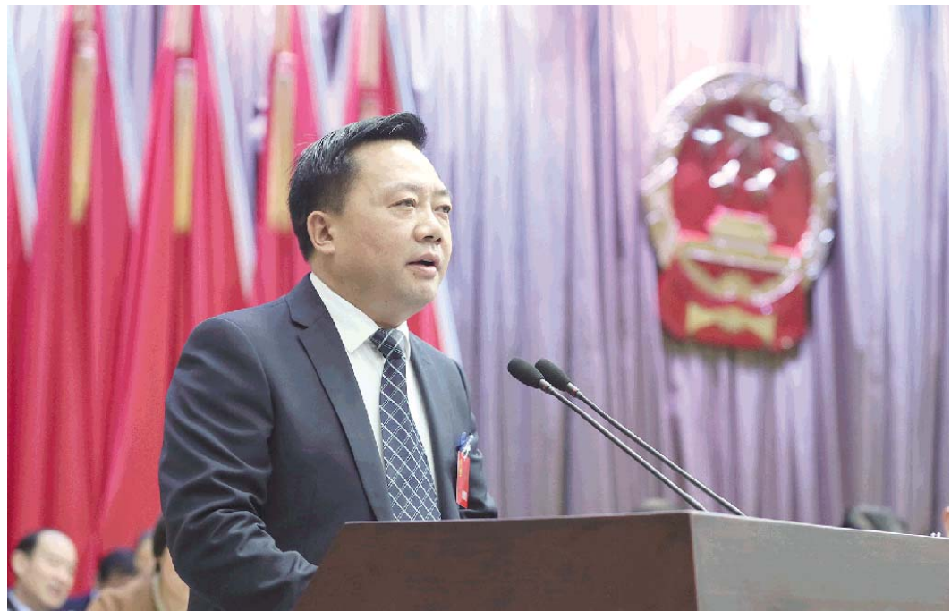
刘凯作政府工作报告