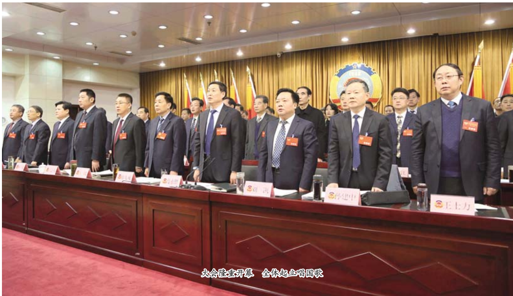
大会隆重开幕 全体起立唱国歌