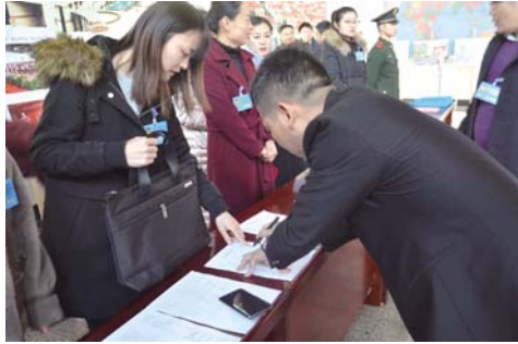
上午8:00，参加区政协第十五届临沂市罗庄区委员会第二次会议的委员、列席人员在区行政办公大楼报到。

1月15日至18日，备受瞩目的临沂市罗庄区第十九届人民代表大会第二次会议、政协第十五届临沂市罗庄区委员会第二次会议隆重举行！肩负全区56万人民的重托，来自全区的人大代表和政协委员汇聚一堂，共谋发展，共议民生。下面是1月15日区“两会”议程。