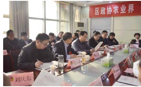
下午2:00，政协委员分组讨论高永胜书记讲话、十五届区政协常委会工作报告、提案工作报告，学习中共十九大精神。