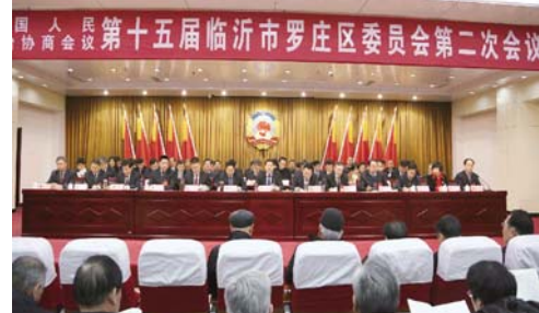
上午10:00，参加区政协第十五届临沂市罗庄区委员会第二次会议隆重开幕。