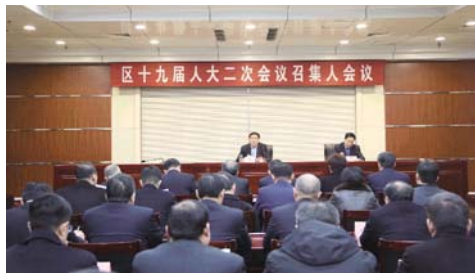
下午2:00，区十九届人大二次会议召集人会议在区行政大楼迎宾馆召开，安排部署会议期间工作。区委书记高永胜出席会议并作讲话，区人大常委会主任魏九成主持会议。