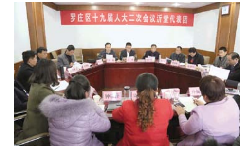
下午2:20，区十九届人大二次会议各代表团推选本代表团团长、副团长，审议区十九届人大二次会议主席团和秘书长名单(草案)，审议区十九届人大二次会议议程(草案)，召开代表中的中共党员会议，成立临时党支部。