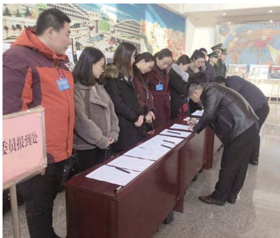
政协委员报到入场